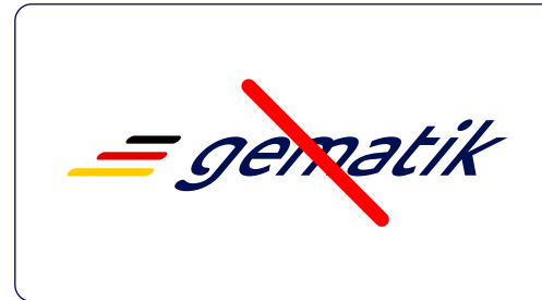
Kein Verzerren des Logos