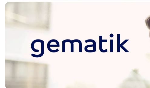
Blaues Logo auf hellem Bildbereich